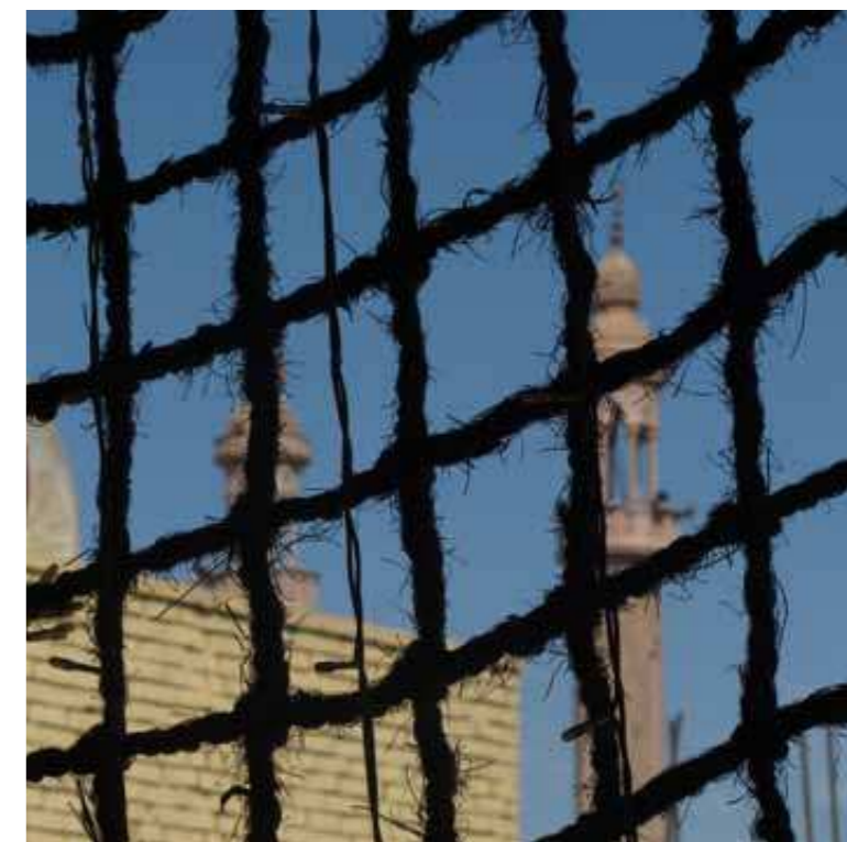
Oben: Blick auf eine Moschee im ägyptischen Assuan.