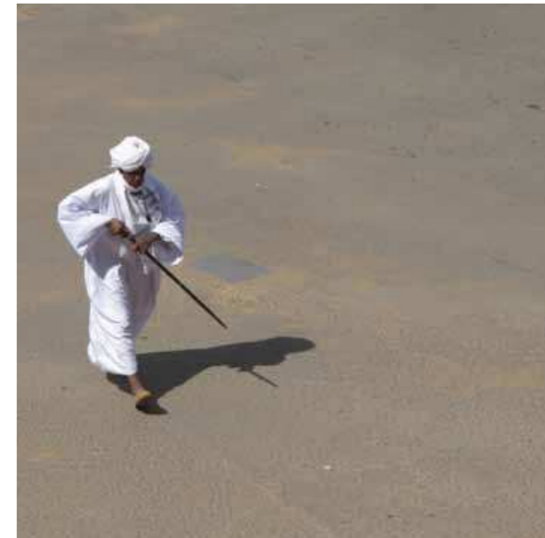
Oben: In der sudanesischen Hauptstadt Khartum überquert ein älterer Mann in landestypischem Gewand eine Straße.

In den Hügeln rund um die gewaltige Felsenstadt Petra, vor Tausenden von Jahren vom Volk der Nabatäer in die Felsen des jordanischen Hochlandes getrieben, bekommt man eine Ahnung von der ursprünglichen Kultur des Landes. Über Jahrhunderte lebten Hirten in den Höhlen des verlassenen Weltkulturerbes. Als ich mit einem englischen Bekannten ein hohes Plateau erklimme, treffe ich dort drei Jungen, die noch nie in ihrem Leben fotografiert wurden. Mit ihren Eltern, ihren Geschwistern, ein paar Ziegen und zwei Dutzend Hühnern leben sie ein Leben ohne großen Kontakt zur Außenwelt. Im Gegensatz dazu ist der Rest des Landes stark nach Westen gewandt: Jordaniens Wüste wurde seit den Tagen