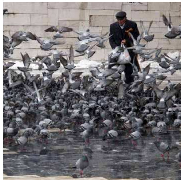
Oben: Straßenszene im verschnittenen Ankara.